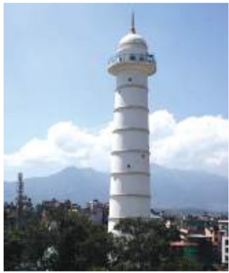
डिडी शर्मा/हिटा काठमाडौं, ८ मंसिर

अब धरहरा चढ्न शुल्क तिर्नुपर्ने भएको छ। सरकारले सःशुल्क रूपमा धरहरा सञ्चालन गर्न